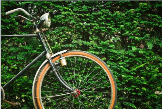
181 Schülerinnen und Schüler unserer Schule beteiligten sich am diesjährigen Stadtradeln.