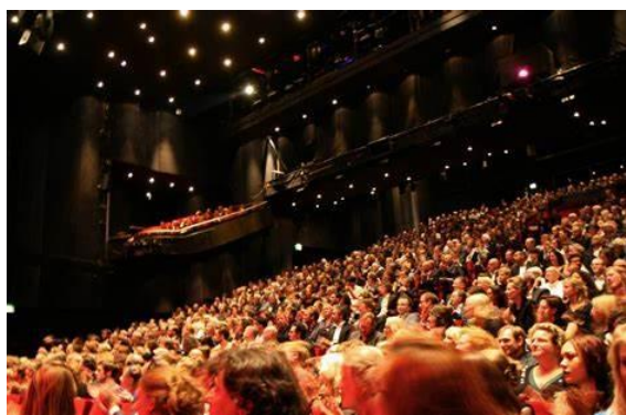
Theater in Erfurt